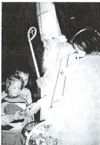
Darček od Mikuláša veľmi poteší.

Hlavné stretnutie s Mikulášom našej obce bolo v piatok 8. decembra 2000 na detskej sv. omši. Po sv. omši Mikuláš slávnostne rozsvietil vianočné osvetlenie, ktoré pripravil obecný úrad.