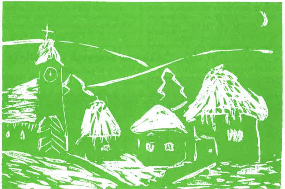
Práca žiaka ZUŠ Valaliky