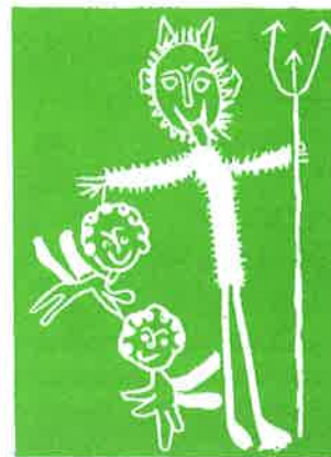
Práce žiakov ZUŠ Valaliky