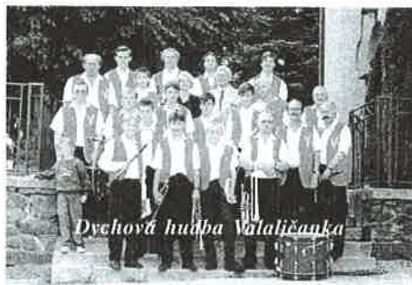
Dychová hudba Valaličanka

Organizátorom podujatia bol Obecný úrad Valaliky a Osvetové stredisko Košice, ktoré prispelo aj finančne na túto akciu.