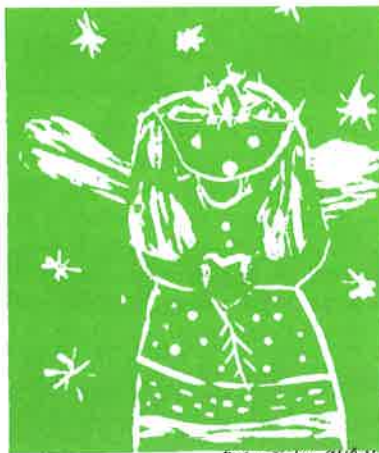
Práce žiakov ZUŠ Valaliky

Je to vynikajúci typ na vianočný darček. Táto kniha by nemala chýbať v žiadnej valalickej domácnosti. Môžete si ju zakúpiť na Obecnom úrade Valaliky za 150,- Sk.