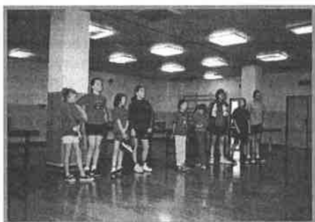
Naše dievčatá v Šarišských Michaľanoch.

Lokomotíva Košice usporiadala majstrovstvá mesta žiakov, na ktoré po prvý raz pozvali aj nás. Chlapci sa prebojovali do štvrtfinále, ale naše dievčatá žiarili. Vo finále hrali proti sebe dve