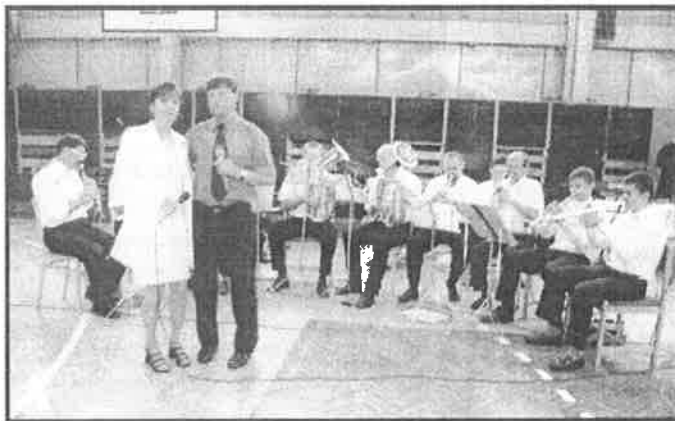
Z vystúpenia dychovej skupiny Valaličanka

Obdobné podujatie ako bol Deň mikroregiónu Hornád zorganizovali aj starostovia olšavského, slaneckého a hornádskeho mikroregiónu v piatok 26. októbra 2001 v obci Ruskov. Spoluorganizátormi podujatia bol Okresný úrad Košice-okolie a Krajský úrad v Košiciach, odbor kultúry a občianske združenie Náš kraj.