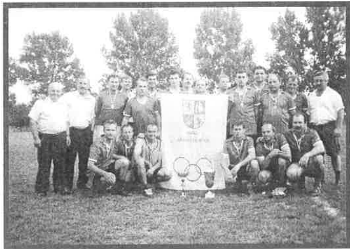
Vítazi futbalového turnaja o Pohár starostu obce, ročník 2001 – mužstvo Buzíc.

svojim jediným v turnaji skóre stretnutia vyrovnal a tak nasledovali penalty. Tu si zachovali chladnejšie hlavy hráči Všechných a vyhrali v pomere 4:2 a tak sa tešili postupu do finále.