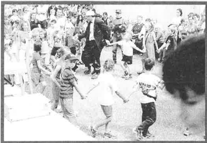
S Vilkom z Drišlaku si prišli na svoje aj najmenší návštevníci jarmoku.