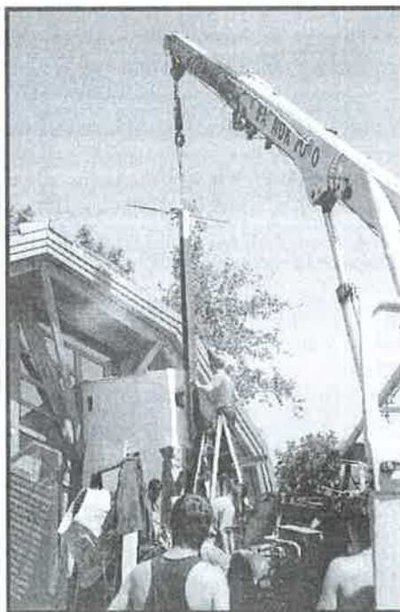
Posledné práce pri osadzovaní kríža na Dome smútku.

rých vybudovaných vetvách je tak malý odber vody, že voda z dôvodu jej neprimerane dlhého státia v potrubí je nekvalitná, o čom svedčia vykonané laboratórne rozborov vody. Prieskumy vykonané s viacerými skupinami pri tom jasne hovoria za najväčší problém v obci občania považujú zásobovanie pitnou vodou. Obdobne o slabom záujme niektorých domácností o pitnú vodu z vodovodu svedčí aj skutočnosť, že aj napriek tomu, že im obec zabezpečila