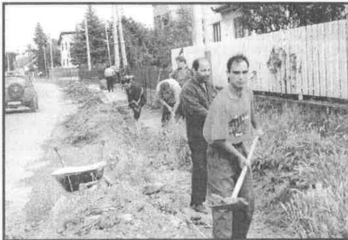
Príprava terénu pre budúci chodník – pracovníci VPP.