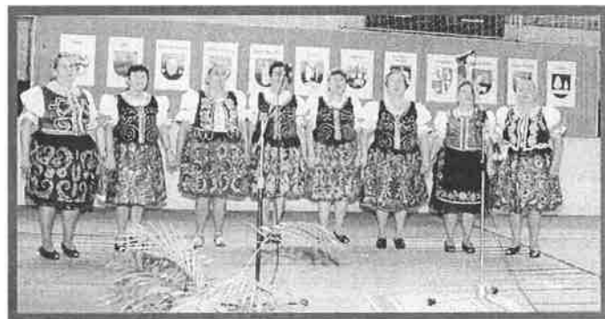
Ženská spevácka skupina Dargovská ruža.

Celkom na tomto podujatí sa zúčastnilo vyše 120 účinkujúcich zo všetkých zúčastnených obcí. Program v dobrej nálade vyústil do spoločného záverečného tanca, v ktorom tanečníci folklórneho súboru zo Sene pozvali na parket prednostu krajského úradu i ostatných verejných predstaviteľov.