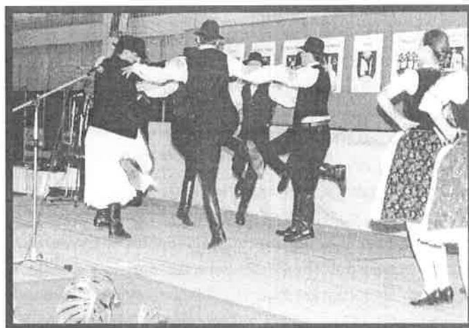
Záverečné vystúpenie folklórnej skupiny Rozmarín zo Sene