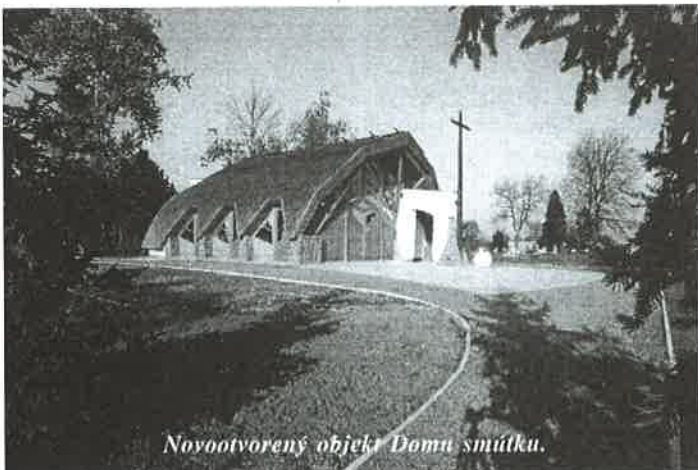
Novootvorený objekt Domu smútku.

Jedinou výnimkou sú práce na výstavbe obecného vodovodu, keď aj napriek nepriaznivému počasiu pracovníci firmy SVIP s.r.o Košice dokončievajú na Poľnej ulici v časti Všetechvátých i na Pastierskej ulici v Buziciach. Celkovo v tomto roku sme výrazne pokročili vo výstavbe rozvodného vodovodného potrubia, ktoré sme vybudovali v celkovej dĺžke 2,4 km. V jarných mesiacoch roka 2002 nás čakajú práce na vodovodných prípojkách na už vybudovaných trasách vodovodu. Následkom tohtoročnej výstavby sa zvýšil podiel vybavenosti obce vodovodom na 52,7 % oproti 35 %-tám z predchádzajúceho roka. Tempo napojenia domácností na vodovod bude v budúcom roku značne závislé od tempa výstavby domovej časti prípojok t.j. od vodomernej šachty po rodinný dom, ktorá je v réžii odberateľov vody.