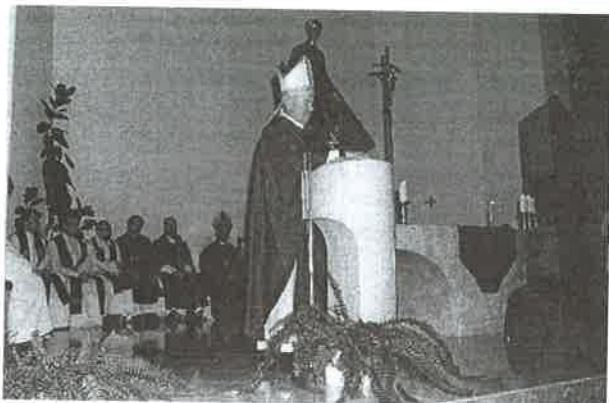
Kardinál Jozef Tomko počas kázne.