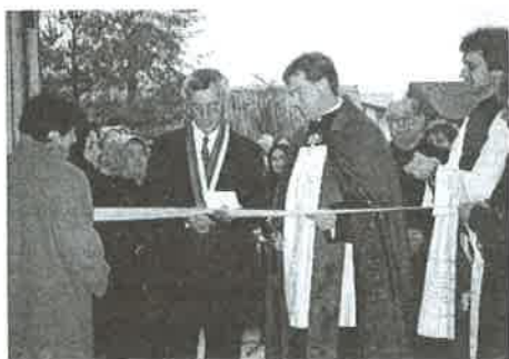
Slávnostné prestrihnutie pásky.

pripomína jednu prekážku tiahnúcu sa večnosťou, ktorú stále budeme musieť prekonávať, no zároveň pevnú istotu niečoho, čo sa začína a končí. Tak nás prevádza pri odchode symbolika prevrátenej a zlomenej lode o kamenný múr. O múr, ktorý v symbolike kríža nám pripomína vykúpenie a v hlahole umieráča rozlúčenie. V útrobach prevrátenej lode spočívame a pripomínáme si posledný krát celú našu púť životom.