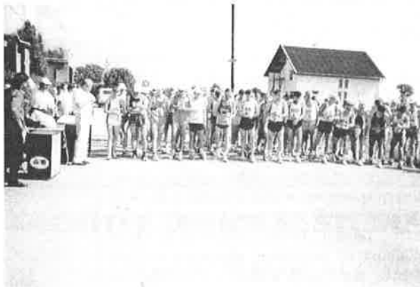
Na štartovacej čiare 12. ročníka Valalickej „20“.

Za účasti 90 pretekárov, medzi ktorými nechýbali reprezentanti z Ukrajiny - Kyjeva, Poľska a Maďarska a samozrejme z celého Slovenska bol o 16.00 hod. odštartovaný tento pretek. Veľmi horúce počasie spôsobilo, že nebol prekonaný traťový rekord, ale aj tak musíme povedať, že pretekári dobiehali do cieľa vo veľmi krátkych časových intervaloch ako nám ukazuje aj výsledková listina: