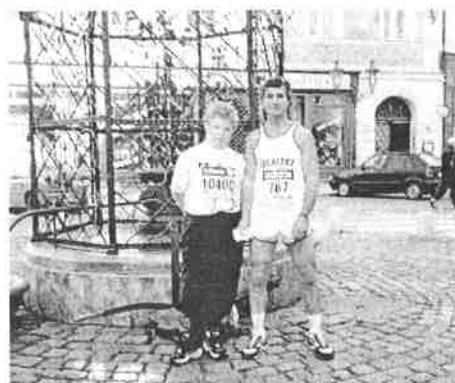
Čigášovci ako účastníci Medzinárodného maratónu mieru v Prahe.