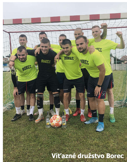
Vít'azné družstvo Borec