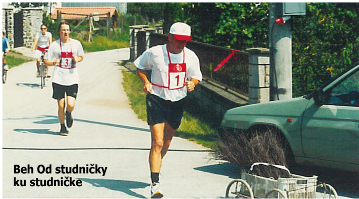
Beh Od studničky ku studničke