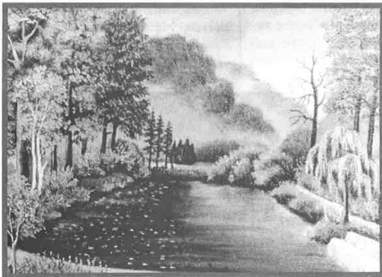
J. Terifaj: Zátišie krajiny

Ocenené práce a ďalšie práce, ktoré vyberie porota z okresnej