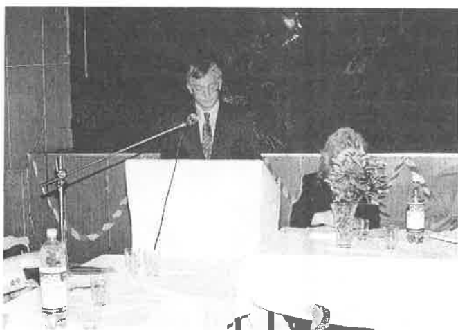
Konferenciu otvoril starosta obce Valaliky.

miestnej kultúry, vedúci a členovia kolektívov ZUČ a starostovia obcí na II. konferencii k otázkam miestnej kultúry okresu Košice-okolie.