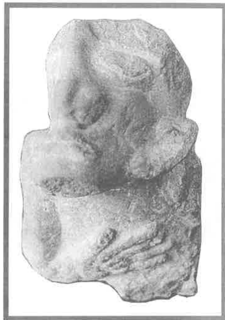
L. Staňo: Kamenná plastika