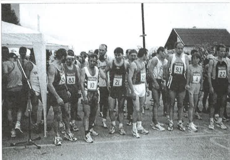
Na štarte 15. ročníka „Valaškej dvadsiatky“.