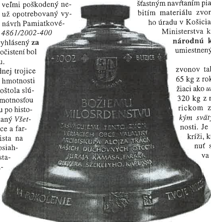
Zvon Božieho milosrdenstva.

Medzeru po histó- zvon venovaný Všet- chrámu, obce a far- razenie Krista na každému dosiah- kríža je posta- Márie, Krá- kých svä- va muža – zastupujú- m u ž o v . pis prezrá-