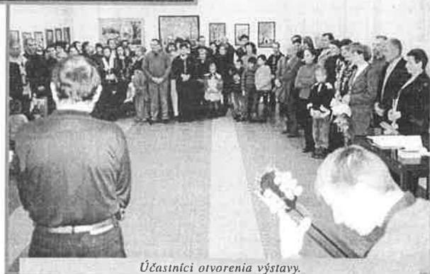
Účastníci otvorenia výstavy.