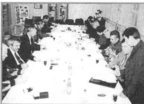
Slávnostné podpisovanie Riečnej koalície.

správcu povodia, firmy, školy, štátne orgány a mimovládne organizácie, ktoré vzájomne rešpektujú svoje potreby a spoločne chcú konkrétnymi krokmi zlepšiť stav životného prostredia. Okrem environmentálneho rozmeru má Riečna koalícia aj sociálny a ekonomický rozmer, prostredníctvom ktorého prispieva k zlepšeniu kvality života miestnych obyvateľov. Projekt má aj svoj cezhraničný rozmer - o.z. SOSNA spolupracuje s organizáciou Holocén z Miškolca, ktorá má svoje aktivity v maďarskej časti povodia Hornádu. O vytváranie Riečnych koalícií prejavili záujem aj ďalšie mimovládne organizácie z Maďarska, Rumunska a Ukrajiny. Pred mesiacom sa uskutočnila už jedna trilaterálna schôdza, na ktorej zástupca o.z. SOSNA referoval o skúsenostiach so zakladaním Riečnej koalície.