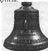
Zvon sv. Jána apoštola.