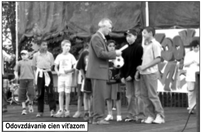
Odvzdávanie cien víťazom