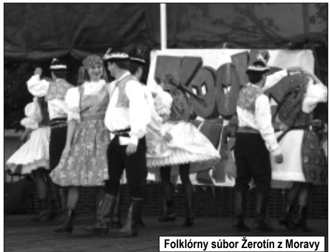
Folklórny súbor Žerotín z Moravy