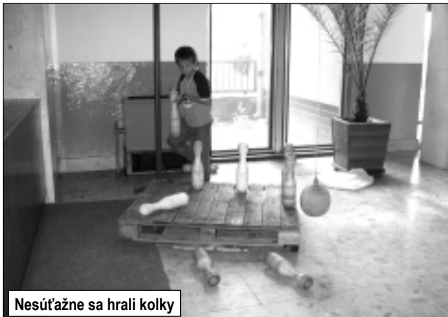
Nesúťažne sa hrali kolky