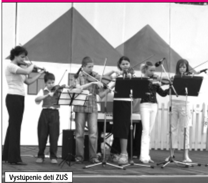
Vystúpenie detí ZUŠ