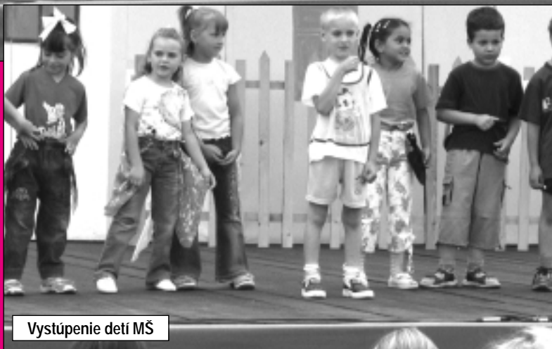
Vystúpenie detí MŠ