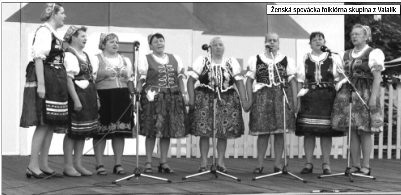
Ženská spevácka folklórna skupina z Valalík

Zámer podujatia „celá obec športuje, celá obec sa zábava“ sa potvrdil. Podľa účasti občanov v sobotu v športových disciplínach a v nedeľu kultúrnom programe sa potvrdilo, že máme mnoho šikovných a schopných občanov od najmladších až po najstarších. Záverom je treba poďakovať všetkým našim poslancom, členom komisií, zamestnancom obce, učiteľom ako aj ostatným spoluobčanom, ktorí počas obidvoch dní veľmi ochotne a nezištne sa podieľali na príprave a zabezpečovaní celého podujatia.