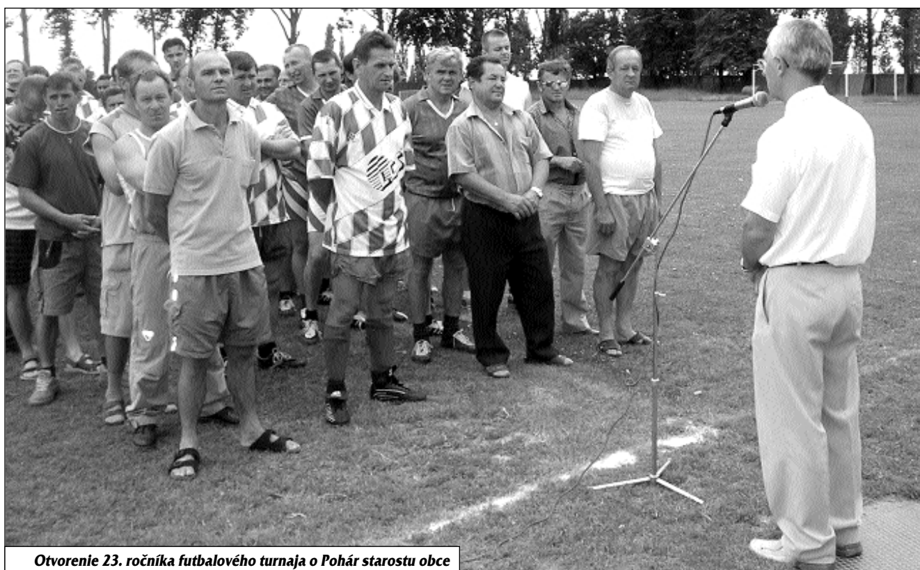
Otvorenie 23. ročníka futbalového turnaja o Pohár starostu obce