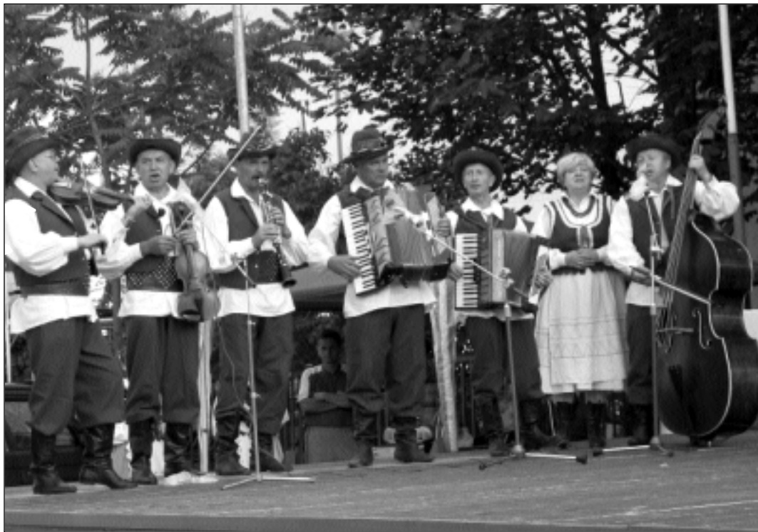
Jednoducho fantastická atmosféra na oslavách valalického sviatku