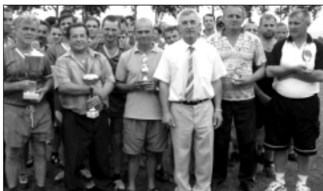
Ceny pre najlepších v turnaji