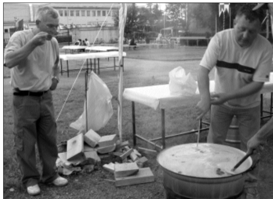
Kvalitu gulášu osobne preveril starosta obce