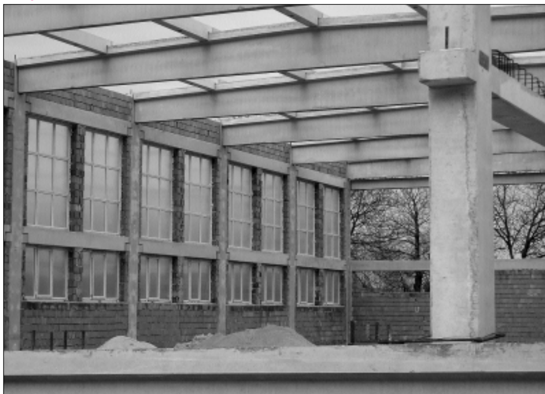
Financovanie telocvične sa rozbehlo dynamicky vpred a dúfame, že bude pokračovať v nastúpenom trende