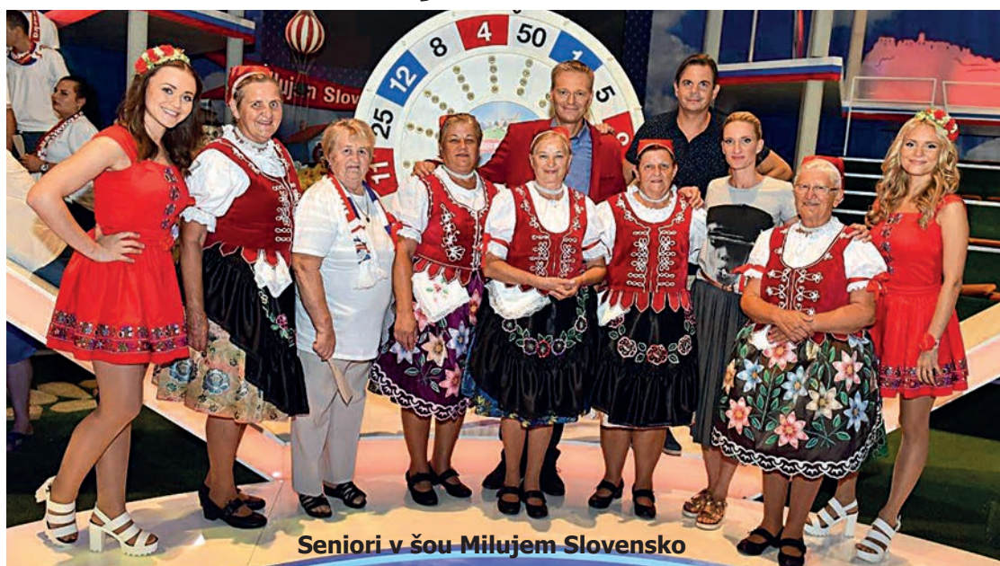
Seniory v šou Milujem Slovensko

Pre svoje zdravie urobili toho veru dost'. Najviac ich lákali Vysoké Tatry. Najprv si boli pozrieť na Hrebienku ľadové kráľovstvo. Cesta za poznaním. Taký bol názov putovania po chodníčkoch našich veľhôr. Aj zájazd Smižany - Spišský hrad sa vydaril nad očakávanie. Levoča - Mariánska hora . To bola