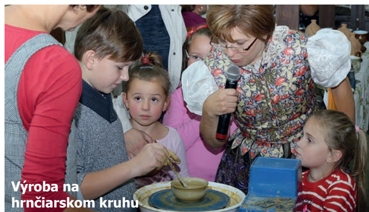
Výroba na hrnčiarskom kruhu