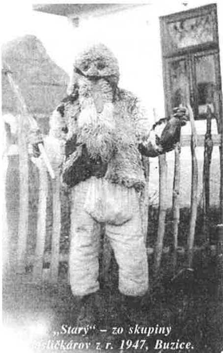
„Stary“ - zo skupiny jasičkárov z r. 1947, Buzice.

Vďačné za dobré výsledky všetkých čitateľov pozdravujú - Misijné sestry