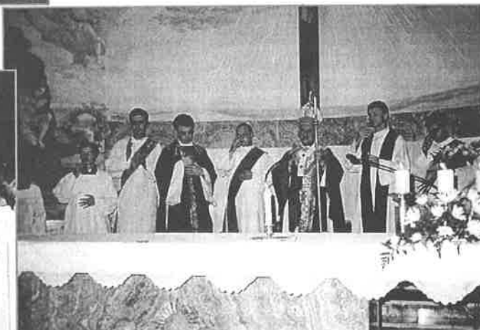
Z večernej Svätej omše.