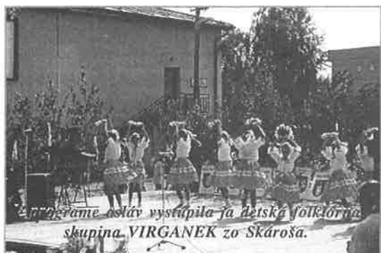
Programom osláv vystúpila ja detská folklórna skupina VIRGANEK zo Skároša.