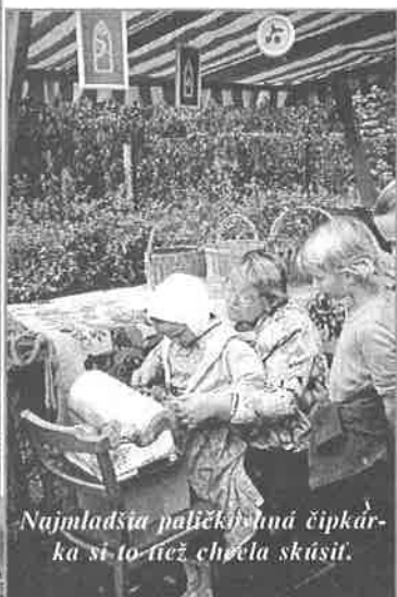
Najmladšia paličková čipkárka si to tiež chcela skúsiť.

stánky a stánky s občerstvením, ktoré sú nevyhnutnou súčasťou takýchto podujatí.