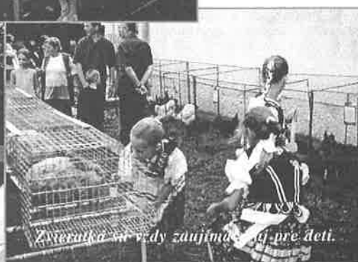
Zvieratka sú vždy zaujímavé najmä pre deti.