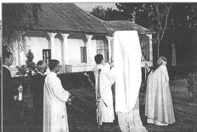
Okamihy slávnostného odhalenia.