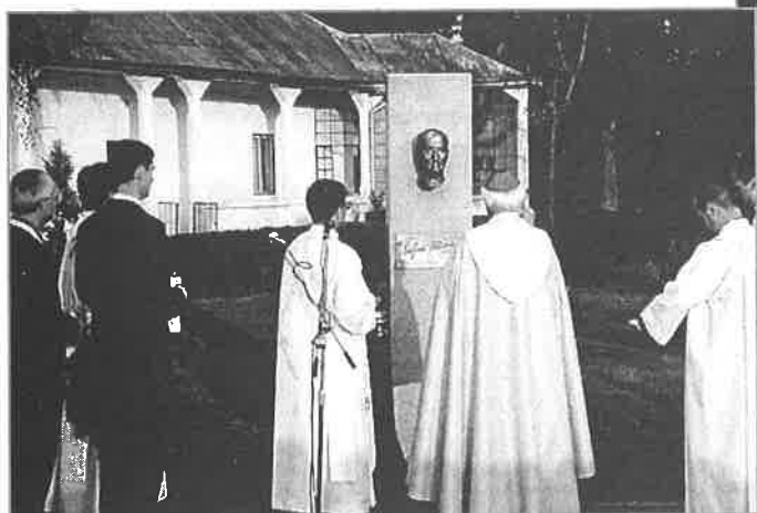
Po odhalení – požehnanie pomníka.