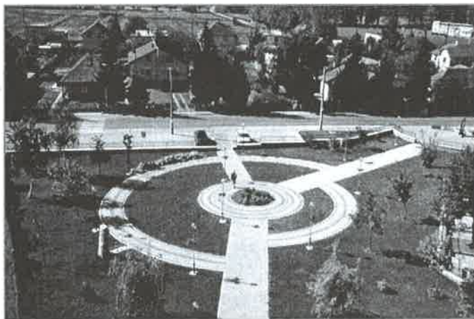
Park Prof. Hlaváča po dokončení – pohľad z kostolnej veže.

V tomto roku sme vybudovali 50 vodovodných prípojok a napojili sme 60 domácností. Vybudovali sme časť vodovodnej vetvy pod vybudovaným chodníkom na Kokšovskej ulici. Podstatné však je, že ešte v tomto roku, v priebehu mesiacov október, november vybudujeme cca. 2 km vodovodu na časti Kokšovskej ulice a na Okružnej ulici v Bernátovciach, keďže v časti Bernátovce je doposiaľ vybudovaná výrazne najmenšia dĺžka vodovodu. Rovnako chceme v tomto roku