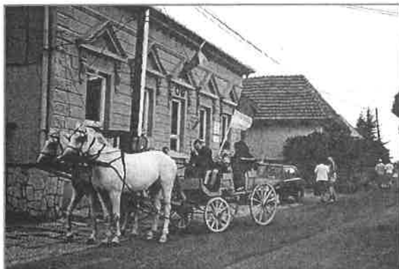
Vlajkonoši sa viezli na dobovom dopravnom prostriedku – koči.

Obec Ždaňa oslávila v sobotu, 14. septembra 780-té výročie od prvej písomnej zmienky. Ždaňa bola ešte začiatkom minulého storočia významnou dedinou. Sídlili tu okrem iného aj okresný súd, z dávnejších čias sa spomína aj okresná väznica. Pri príležitosti tohto výročia vydala obec knihu o svojej histórii, ktorej autorom je Mgr. Štefan Kolivoško zo Sene. Slávnosť bola spojená so ždaňanským jarmokom ako aj s oslavou 10-tého výročia mikroregiónu Hornád.