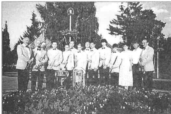
Najlepšia dychovka v okrese Košice-okolie – Valaličanka.

Dychová hudba Valaličanka opäť najlepšia