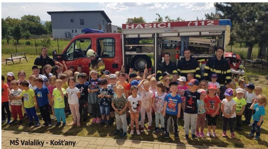
MŠ Valaliky - Košťany

V máji región Abova sužovali husté dažde. Naša jednotka bola privolaná na pomoc do obce Nižná Hutka. Voda tam ohrozovala obyvateľov, bolo nutné zabrániť vyliatiu vody do obydľí pomocou vriec s pieskom. Následne sme túto vodu dlhé hodiny odčerpávali spoločne s dobrovoľnými hasičmi z okolitých obcí. Po tomto zásahu sme sa presunuli do Valalík na Malú ulicu, ktorú dažďová voda neustále zaplavuje. Aj tu sme boli nútení odčerpať stále pritekajúcu vodu. Mužstvu, ktoré bolo po dlhotrvajúcom zásahu veľmi vyčerpané,