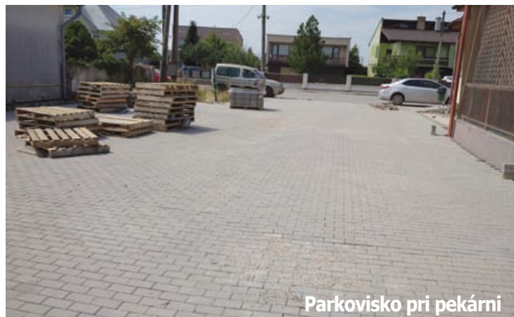
Parkovisko pri pekárni

Riaditeľka Základnej umeleckej školy Valaliky pri príležitosti 45. výročia vzniku školy sa listom podakovala orgánom obce Valaliky za dobrú spoluprácu. Najbližšie plánované zasadnutie zastupiteľstva je v septembri. Jana Pelegrin