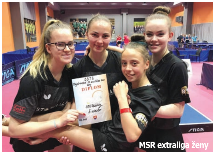
MSR extraliga ženy

Stolnotenisová sezóna bola aj pre hráčov STO VALALIKY značne poznačená obdobím korona vírusu.