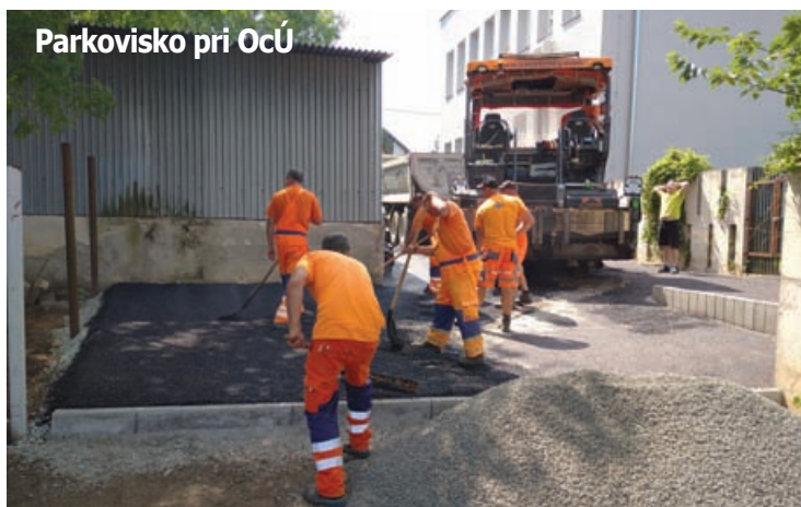
Parkovisko pri Ocu

Pripravujú sa podklady k podaniu návrhu na vydanie územného rozhodnutia na stavbu rozšírenia