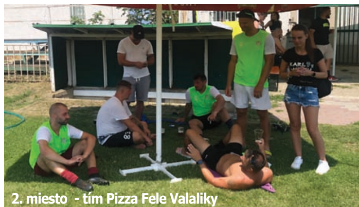
2. miesto - tím Pizza Fele Valaliky