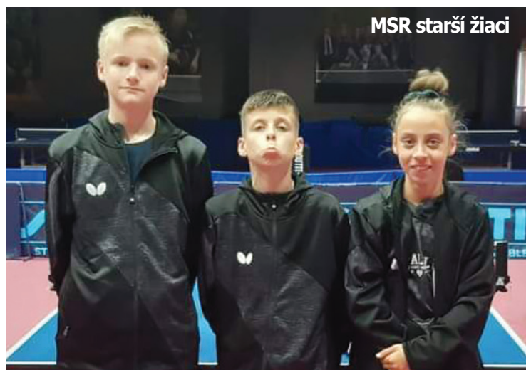
MSR starší žiaci