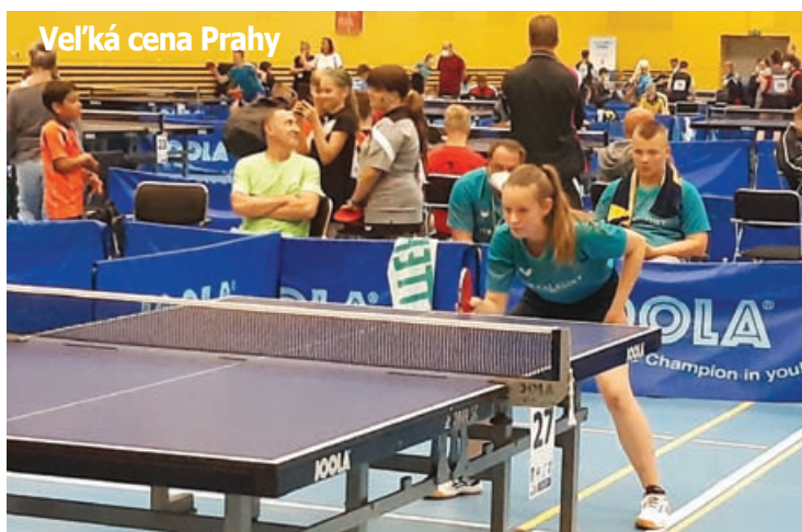
Veľká cena Prahy