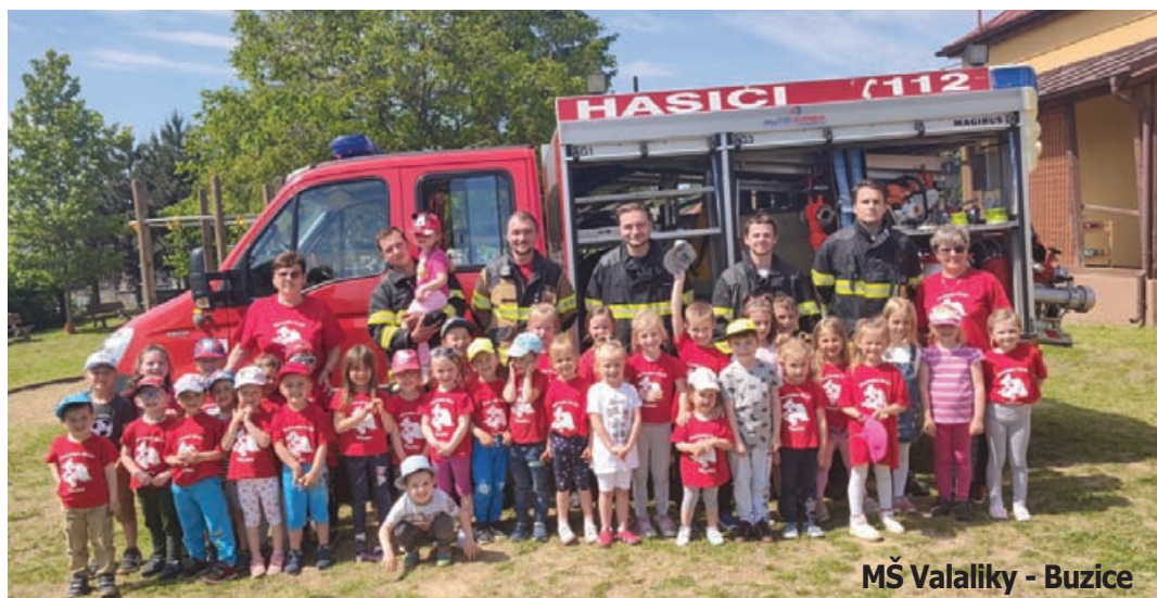
MŠ Valaliky - Buzice