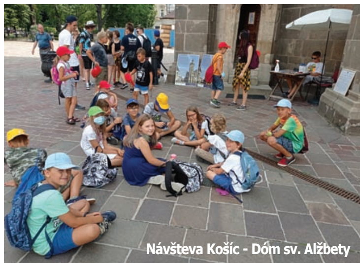
Návšteva Košíc - Dóm sv. Alžbety