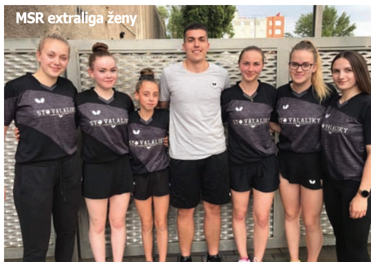
MSR extraliga ženy