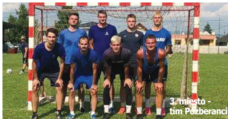
3. miesto - tím Pozberanci