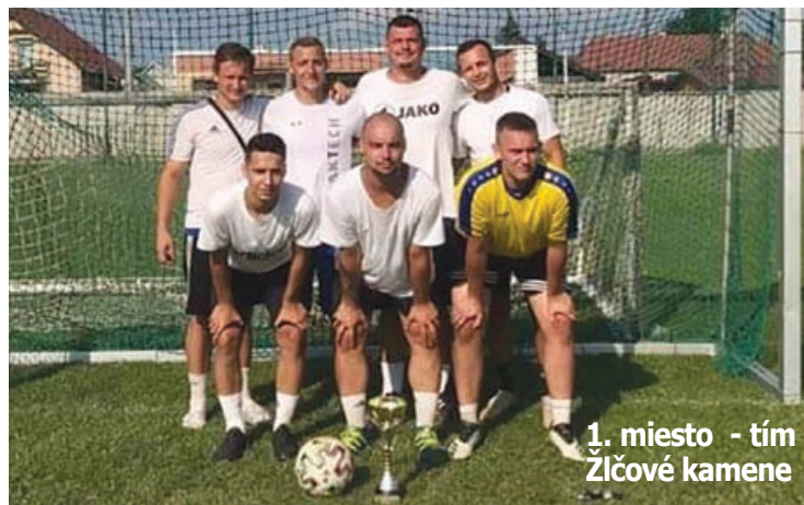
1. miesto - tím Žlčové kamene