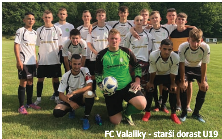
FC Valaliky - starší dorast U19