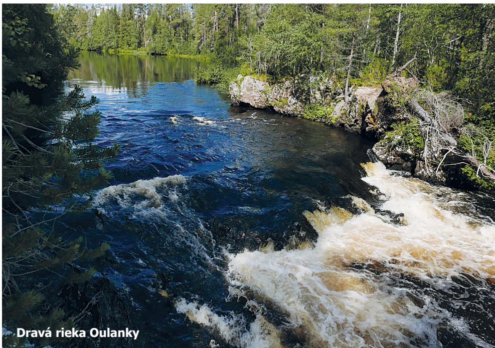
Dravá rieka Oulanky

Ak máte deficit železa, v okolitých lesoch sa môžete dosýta nabažiť čučoriedok. Sú všade, sú voňavé, sladké a majú krásnu tmavú farbu. Ale Fíni oblubujú radšej podobne vyzerajúce oranžové bobulky, latinsky Rubus chamaemorus , alebo po našom